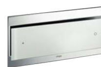
Visign for More 102 Metall, klar/ljusgrå

Metall: Förkromad, Matt krom, Rostfritt stål, Guld. Glas 1) : Klar/ljusgrå, Svart, Klar/mintgrön.