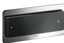
Visign for More 103 Glas, svart

Metall: Förkromad, Matt krom, Rostfritt stål, Guld. Glas 1) : Klar/ljusgrå, Svart, Klar/mintgrön.