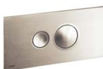
Visign for Style 10 Plast, stålfärgad

Plast: Alpin vit, Förkromad, Pergamon, Matt krom, Rostfritt stål, Djup svart, Guld.