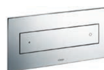
Visign for Style 12 Plast, matt krom

Plast: Alpin vit, Förkromad, Pergamon, Matt krom, Rostfritt stål, Guld.