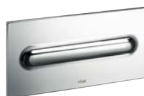
Visign for Style 11 Plast, krom

Plast: Alpin vit, Förkromad, Pergamon, Matt krom, Rostfritt stål, Djup svart, Guld.