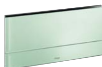
Visign for More 101 Glas, klar/mintgrön

Metall: Förkromad, Matt krom, Rostfritt stål, Guld. Glas 1) : Klar/ljusgrå, Svart, Klar/mintgrön.