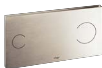
Visign for More 100 Metall, rostfritt stål

Metall: Förkromad, Matt krom, Rostfritt stål, Guld. Glas 1) : Klar/ljusgrå, Svart, Klar/mintgrön.