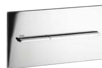
Visign for More 104 Metall, förkromad

Glas: Klar/ljusgrå, Svart, Klar/mintgrön.