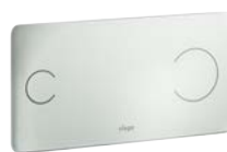
Visign for More 103 Glas, beröringsfri, klar/ljusgrå

Metall: Förkromad, Matt krom, Rostfritt stål, Guld. Glas 1) : Klar/ljusgrå, Svart, Klar/mintgrön.