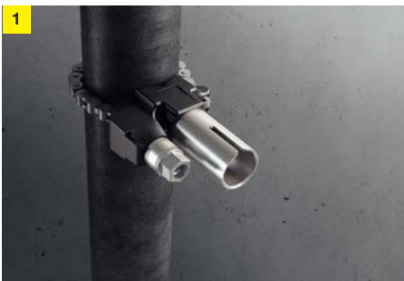
1 Fästanordning för inspänning av borraraxeln runt stålroret.