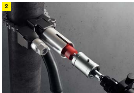
2 Håltagning med hjälp av en standardbormaskin. Därefter tas hållaren bort.