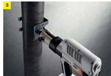
3 Pressning av inpressningsstudsens i roret med pressmaskin och pressinsats.