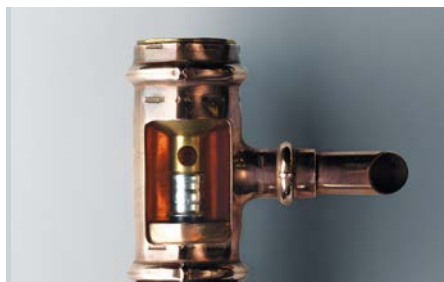
Toppanslutningen på smartloop inliner.