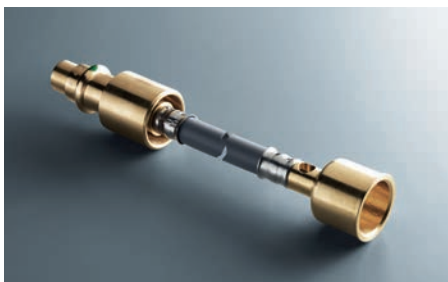
Topp och bottenanslutningen för 12 mm PB slang.

installationskostnaderna, sparar plats och säkerställer en stabil temperatur i hela stigarledningen. Med hjälp av Viegas Easytop cirkulationsventil får du också kontroll på temperaturen och bakterierna!